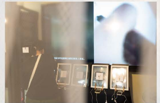
▲後期（畢業展覽當天）