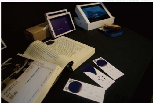
▲第三展區（印章、複寫紙操作影片、周邊）